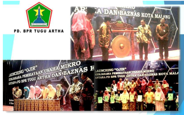
Launching Program Ojir: Peresmian program ojir, penandatanganan perjanjian dengan Peserta Program Ojir, dan sesi foto bersama

Menyalurkan pinjaman lunak tanpa bunga dan agunan kepada warga kota malang yang terjerat rentenir. Sehingga diharapkan dapat melepaskan masyarakat dari jerat rentenir dan mengembangkan usahanya