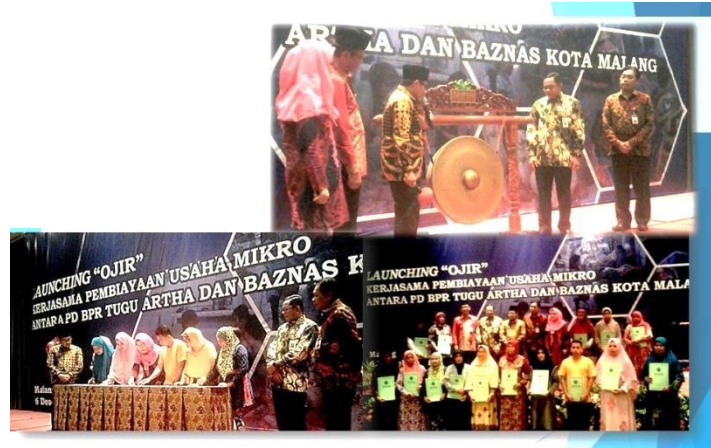
Launching Program Ojir: Peresmian program ojir, penandatanganan perjanjian dengan Peserta Program Ojir, dan sesi foto bersama

Menyalurkan pinjaman lunak tanpa bunga dan agunan kepada warga kota Malang yang terjerat rentenir. Sehingga diharapkan dapat melepaskan masyarakat dari jerat rentenir dan mengembangkan usahanya